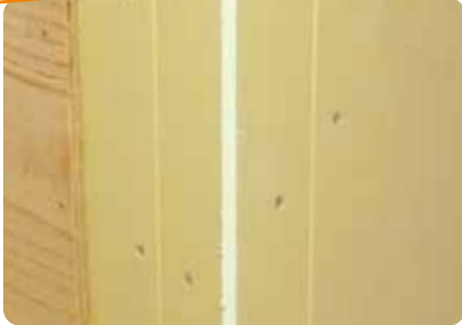
石膏ボードでの施工