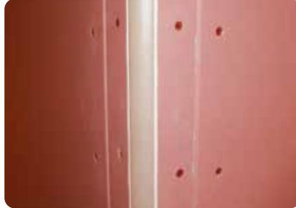
樹脂製品での施工